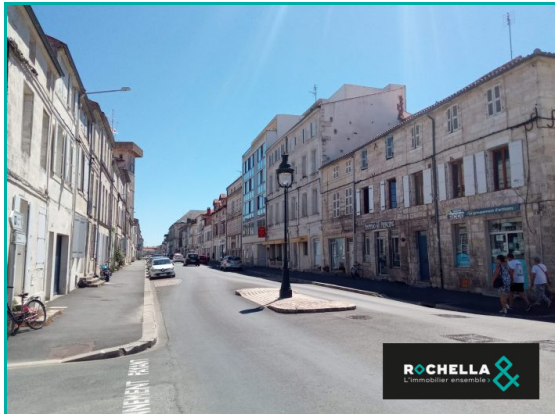
vue d'ensemble rue